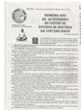
FIG. 4 – Boletim do CEHC n.º 1, de Julho de 1997