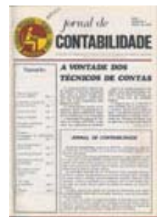
FIG. 3 – Capa do Jornal de Contabilidade n.º 1, de Abril de 1977