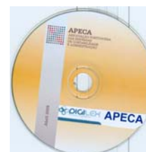
Fig. 13 – CD de Legislação