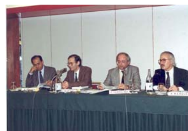
Fig. 9 – 1.ª Acção de Formação em Lisboa