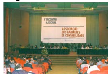
Fig. 3 - 1.º Encontro Nacional dos Gabinetes de Contabilidade

De notar, porém, que, em 26 de Março de 1988, foi realizado o “1.º ENCONTRO NACIONAL DOS GABINETES DE CONTABILIDADE”, na Exponor, em Leça da Palmeira (Fig. 3), com a presença de representantes de 88 empresas, o qual visou, precisamente, a constituição da APECA. O Boletim APECA n.º 1 (pp. 1, 3, 4 e 5) desenvolve os factos mais importantes desse Encontro, em artigo sob o título “Histórico da APECA” que, como já referimos, transcrevemos na íntegra (Anexo n.º 1).