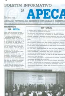
Fig. 6 - Boletim Informativo APECA n.º 1, de Outubro de 1988

No início da sua publicação, o Boletim designava-se “Boletim Informativo da APECA”, a qual se manteve até ao n.º 57, de Novembro/Dezembro de 2005, passando a partir do número seguinte a intitular-se abreviadamente “Boletim APECA”, conforme mencionado na capa, apesar de as páginas interiores continuarem a referir “Boletim Informativo”. Essa alteração da designação não foi divulgada no próprio Boletim, pelo que se depreende que tenha sido uma mera medida de simplificação.