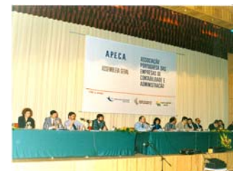
Fig. 1 – 1.ª Assembleia Geral da APECA em 21 de Maio de 1988

No QUADRO N.º 1 seguinte descrevemos os 20 primeiros associados: