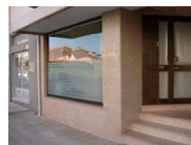
Fig. 4 – Exterior das instalações da sede

No Boletim n.º 8, de Maio de 1989, refere-se a alteração das instalações da sede, a partir de 1 de Janeiro de 1989, para a Rua Avelino Santos Leite, n.º 16, Apartado 205, 4471 Maia Codex, a qual se mantém até esta data (Fig. 4).