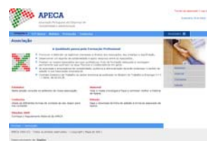
Fig. 12 – Homepage do site

O site da APECA, após o seu lançamento em 1998, foi reformulado duas vezes, uma em 2001 e outra em 2004, estando já prevista uma terceira remodelação (Fig. 12).