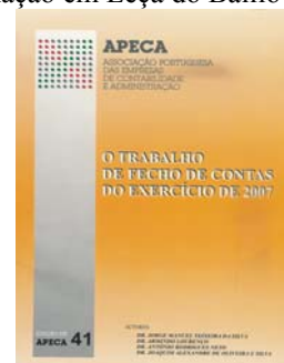
Fig. 11 – Livro “Trabalho de Fecho de Contas – Exercício de 2007”