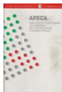
Fig. 7 - Boletim APECA n.º 120, de Janeiro/Março de 2005

Nos menus “Contabilidade/Associações/Em Actividade/APECA/Publicações” e “Bases de Dados/Revistas” do nosso Portal INFOCONTAB, disponibilizamos os dados dos artigos publicados no Boletim APECA desde o seu primeiro número, com indicação do n.º da revista, título do artigo, autor, páginas e n.º de páginas, permitindo a pesquisa por “Título/Autor” e por “Revista (n.º)”.