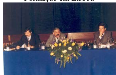
Fig. 10 – 1.ª Acção de Formação em Leça do Balio