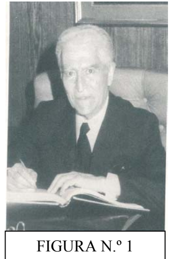
FIGURA N.º 1

O estudo das obras dos nossos Mestres é uma forma de lhes demonstrar gratidão e de os homenagear. Assim, por força do nosso crescente entusiasmo pela investigação em História da Contabilidade, temos destacado os seus principais intelectuais portugueses, como fizemos no livro “História da Contabilidade em Portugal – Reflexões e Homenagens” (Ed. Áreas Editora, Braga, Janeiro de 2005).