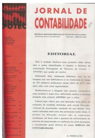
FIGURA N.º 2 – Capa do Jornal de Contabilidade n.º 196, de Julho de 1993

O JC manteve o design e formato inicial durante mais de dezasseis anos (195 números). A primeira alteração ocorreu com a publicação do n.º 196, de Julho de 1993, Ano XVII (FIGURA N.º 2) 5 , tendo-se mantido até ao n.º 273, de Dezembro de 1999.