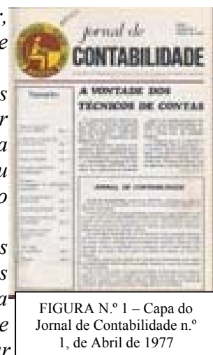
FIGURA N.º 1 – Capa do Jornal de Contabilidade n.º 1, de Abril de 1977

Para além dos artigos da responsabilidade da Direcção e da colaboração por esta solicitada, poderão ser inseridos escritos enviados