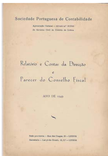
Fig. n.º 4 – Relatório e Contas da Direcção e Parecer do Conselho Fiscal de 1949

Este mesmo facto é mencionado no Relatório e Contas da Direcção e Parecer do Conselho Fiscal de 1949, o qual foi apresentado numa brochura (FIGURA N.º 4), mencionando que tais comunicações foram apresentadas na secretaria da SPC (Largo do Chiado, 12-2.º, Lisboa).