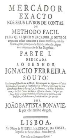
Fig. 2 –Mercador Exacto nos seus Livros de Contas..., de João Baptista Bonavie, Lisboa, 1758.