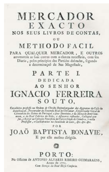
Fig. 3 – Mercador Exacto nos seus Livros de Contas... , de João Baptista Bonavie, Porto, 1771.

Perante estes factos surgiu-nos, também, a dúvida sobre quantas edições foram publicadas, e se, efectivamente, foi publicada apenas a “I Parte” do livro.