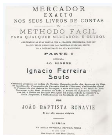
Fig. 4 – Mercador Exacto nos seus Livros de Contas... , de João Baptista Bonavie, Lisboa, 1779.

No entanto, as três capas do livro (Fig. N. os 2, 3 e 4) apresentam as diferenças mencionadas no Quadro3 seguinte: