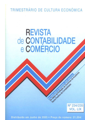
Fig. 3 - N.º 234/235 da “RCC”