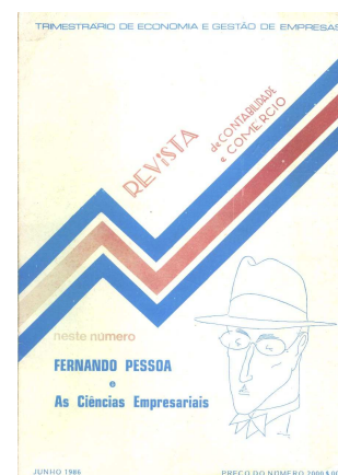
Fig. 2 - N.º 193/196 da “RCC”

O n.º 1 (Fig. n.º 1) contém uma imagem do Deus da Comunicação e do Comércio - “Hermes - Mercúrio”. A actual publicação tem a configuração constante da “RCC” n.º 234/235, Vol. LIX, de Junho de 2003 (Fig. 3).